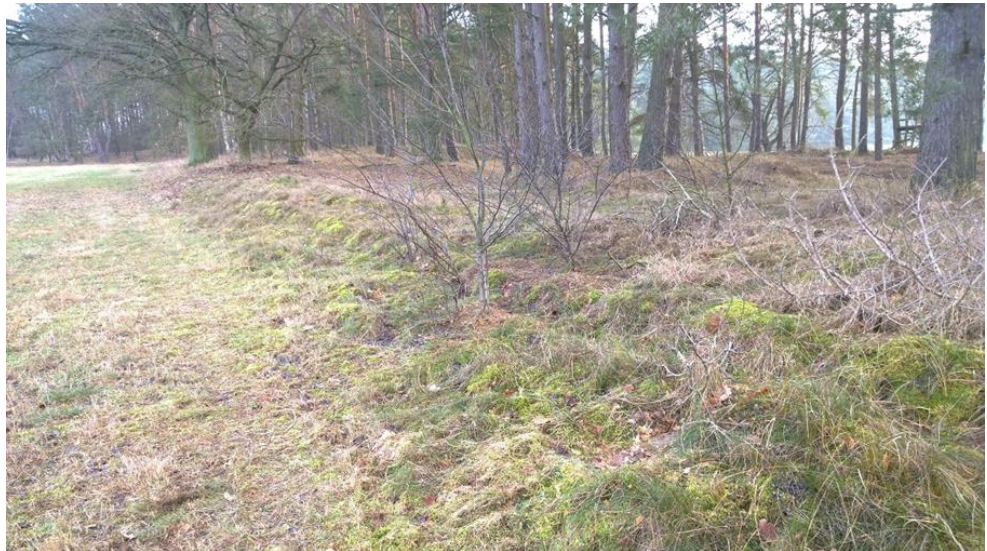
Bild 4: Freigeschobene und entbuschte Sandkante (07.-08.02.2019)