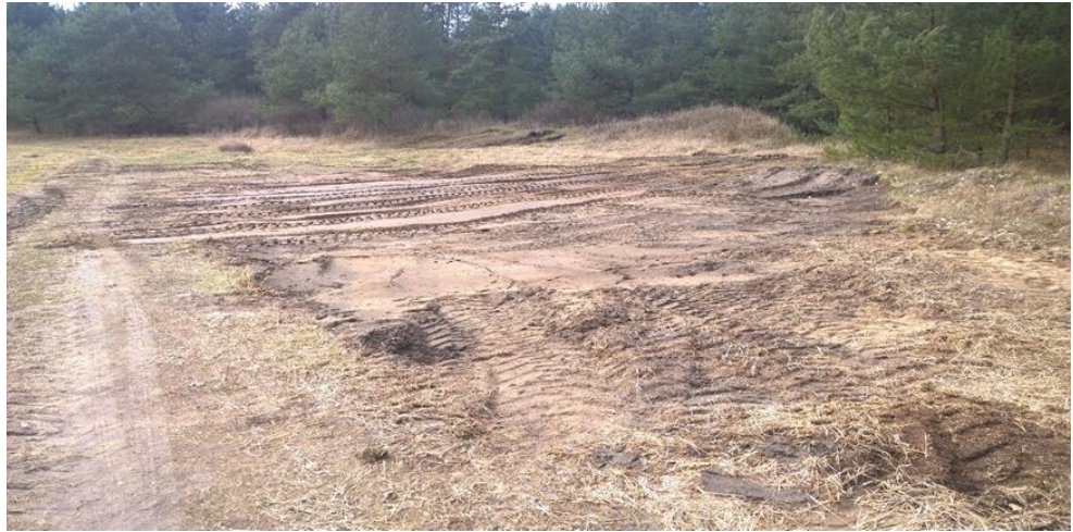
Bild 3: Vergraste und verbuschte Sandkante (Spätblühende Traubenkirsche, Stand 01/2019)