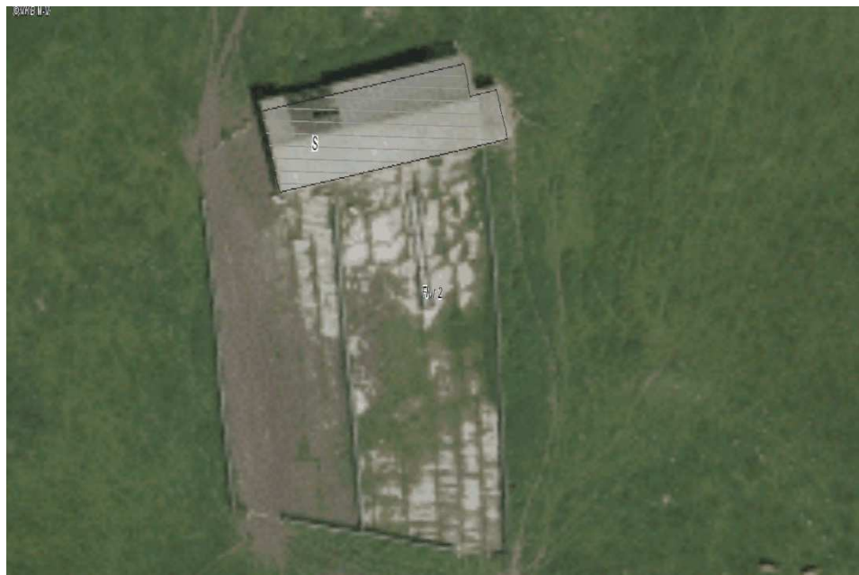
Foto 2: Freifläche und Hochbau des Melkstandes (Orthophoto Stand 2013)